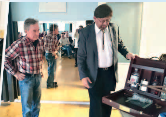
"Kannattipa käydä verta luovuttamassa..."