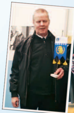
Ristoa muistettiin standardilla.