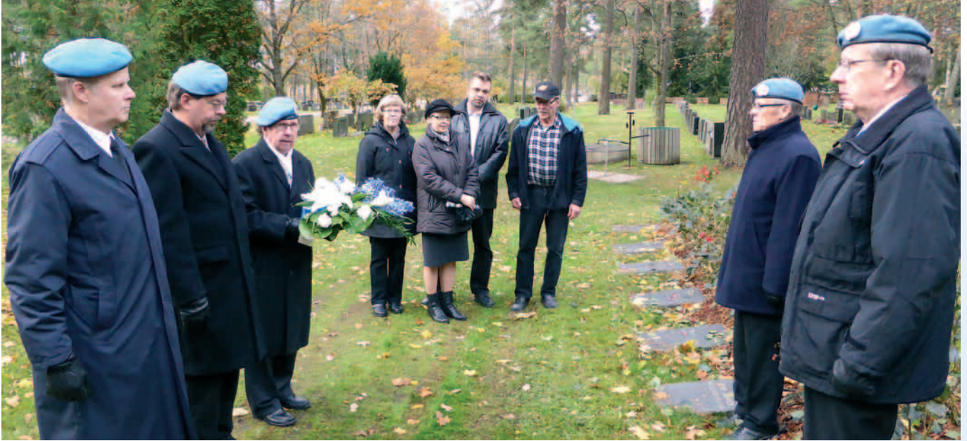
Seppelten lasku Levon hautausmaalla.