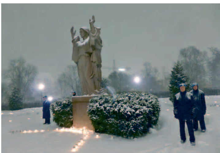
Kunniavartio lumituus- kussa.