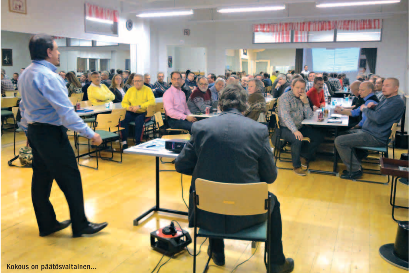
Kokous on päätösvaltainen...