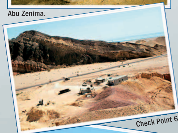
Check Point 6.