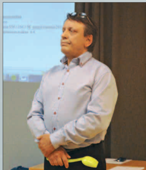
Viimeiset hetket puheenjohtajana...