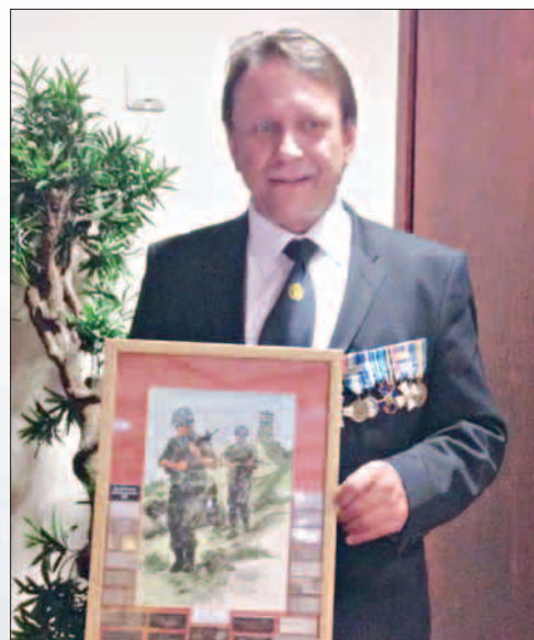
Parhaan yhdistyksen kiertopalkinto 2014.

TEKSTI: JARMO LAINE