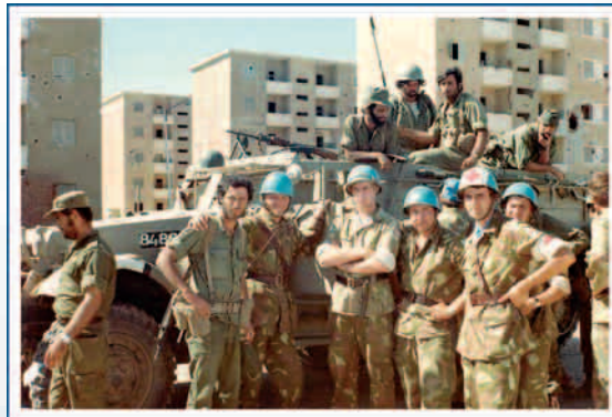
Saapuminen Suezille 28.10.1973.