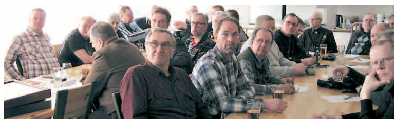
Kokous järjestettiin ravintola Tukkijätkän kokoustiloissa.

Yhdistyksemme Heinolan alaosasto oli ottanut kokouksen järjestelyvastuun tällä kertaa harteilleen. Kokouspaikaksi oli varattu ravintola Tukkijätkä. Sen kokoustilat osoittautuivat erittäin sopiviksi käyttömme, jälleen kerran.