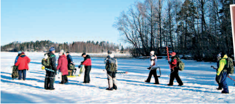
Lähtölaukaus on pamahtanut.