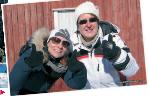
Kannustajat villeinä. ▶