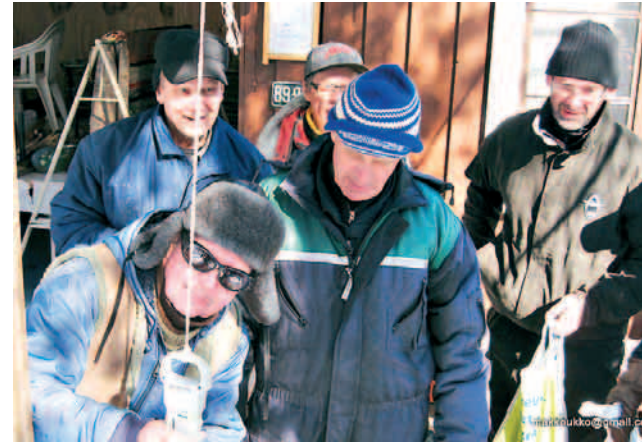
Punnitus on tarkkaa hommaa.

TEKSTI: JARMO LAINE.