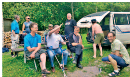
Talkootyön tunnelmaa ...

Salpausselän kisat helmikuussa, joi- sa parisenkymmentä jäsentä piti ki- sojen ajan laskumäet puhtaina. Toki Salppurilla muutakin tehtiin.