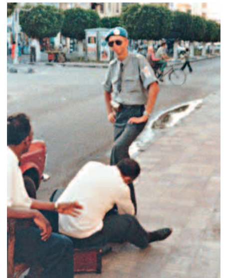
Hoikka poika Hollolasta, mutta kengät kiiltää.