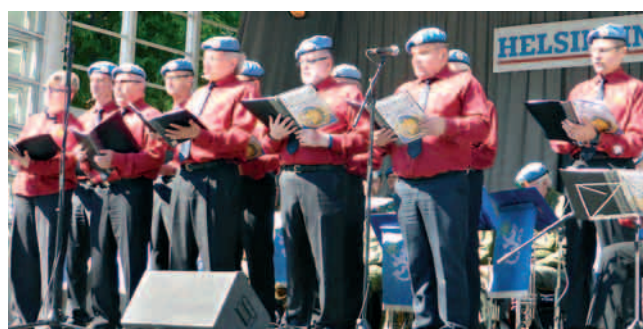
Killit Espan lavalla.