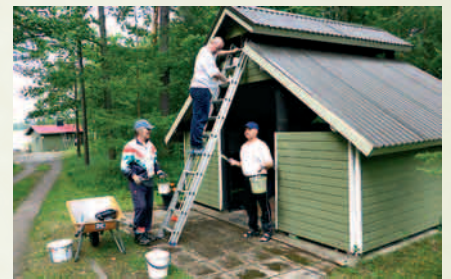
Majan grillikatosta fiksataan.