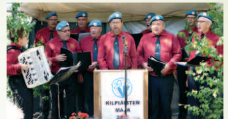
Killit esiintymässä Veteraaneille.