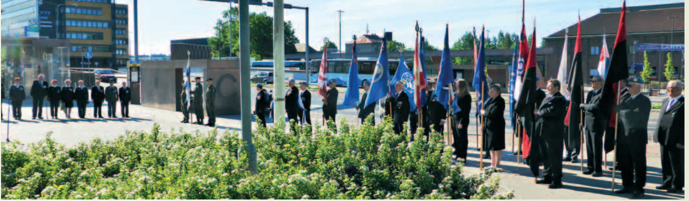
Baretit mukana lippulinnessa.