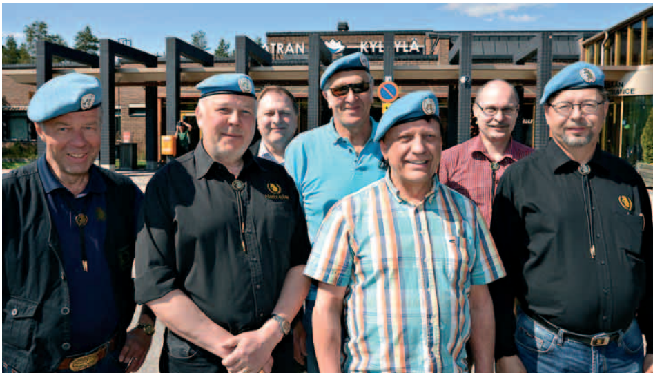
Päijät-Hämeen Rauhanturvaajat ry:n edustajat SRL:n Imatran keväλλιittokokouksessa.

Päijät-Hämeen Rauhanturvaajat ry kiittää yhteistyökumppaneita heidän panoksestaan, kun autamme sotiemme Veteraaneja.