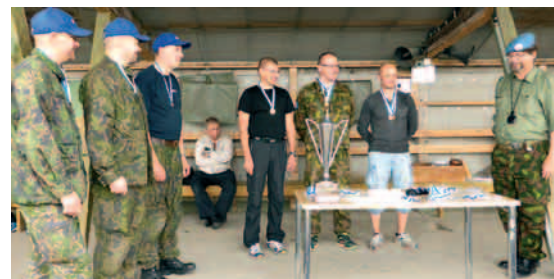
Palkintojen jaossa naurattaa jo.