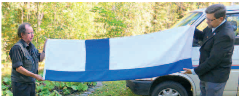
Tyllinäyte lipun taitosta.

Yhteismajan ylläpito vaatii varsin paljon työtä. Aina kesän aluksi yhdistyksemme väki käy tarkistamassa paikat, laittamassa laiturin paikalleen ja avaamassa ikkunoiden luukut. Puutyöt ovat myös melkoinen urakka. Majan alueen rakenteita on vuonna 2016 maalattu ja korjailtu. Saunaan hankittiin uusi kiuas.