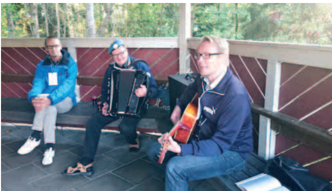
Jari ja Allu vauhdissa.