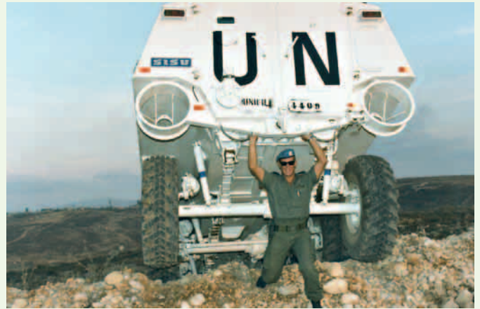
Arto Libanonissa voimansa tunnossa.

TEKSTI: JARMO LAINE