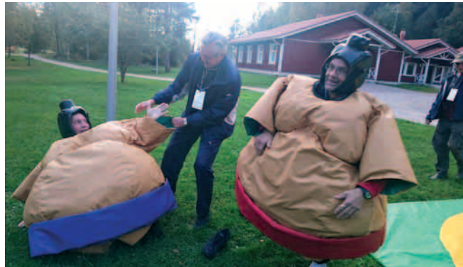
Painit ennen saunaa...

Lipunnoston ja ohjelman läpikäynnin jälkeen päästiin asiaan. Aluksi käytiin läpi tiukka ottelu ennalta määritetyin joukkuein. Ammunnan ja mölkyn jälkeen vierailia oli poikkeuksellisesti mahdollisuus painiin jo ennen saunaa.