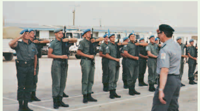
Kenraali Valtasen vierailu asemalla 9-34. Arto D0:na vas.