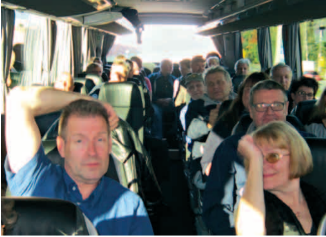
Linja-autossa on tunnelmaa.