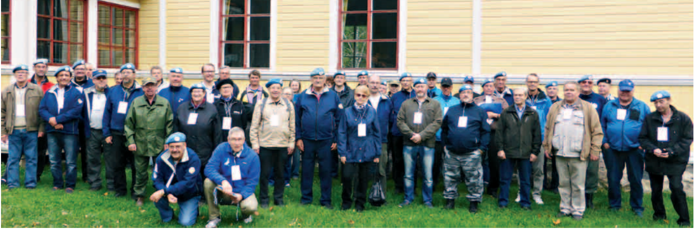
Talkoolaiset valmiina illan haasteisiin.