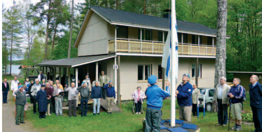
Veteraanien kesäkauden avaus.

P äijät-Hämeen Rauhanturvaajat ry on jo vuosia tukenut veteraaneja Sotaleskien ja -veteraanien yhteismajan kunnostuksessa, huollossa, hoidossa ja ylläpidossa. Jäseniämme on myös yhdistyksen hallituksessa. Kesäisin maja on myös meidän yhdistyksemme yksi kiintopisteistä. Siellä pidetään kuukausikokoukset ja saunotaan aina maanantaisin ja torstaisin. Majalla myös avataan ja päätetään kesäkausi. Lisäksi rauhanturvaajat osallistuvat moniin veteraanien aktiviteetteihin ja myös järjestävät veteraaneille monenlaisia tapahtumia.