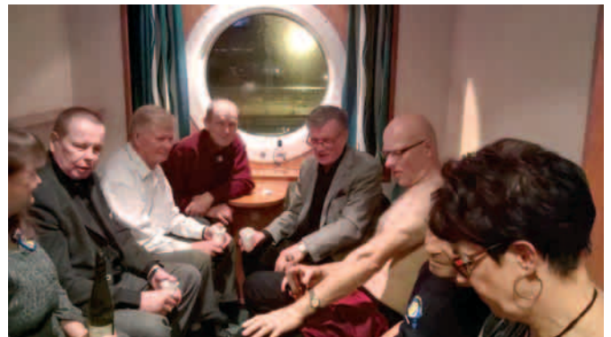
PHRT:n väki omassa porukassa.