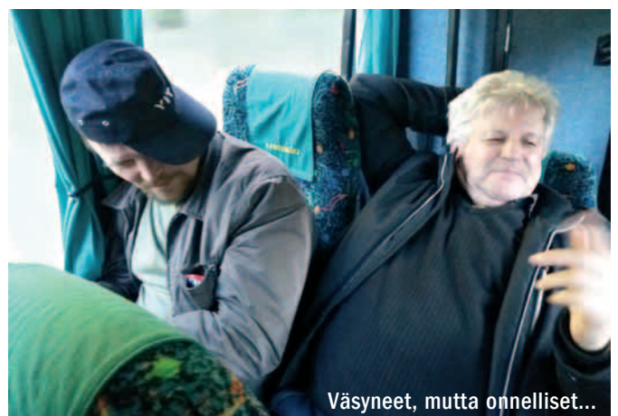
Väsyneet, mutta onnelliset...