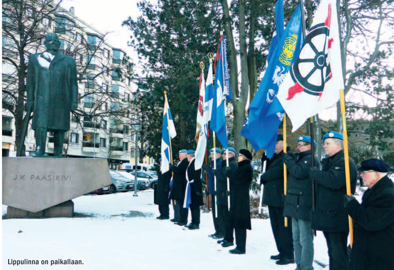
Lippulinna on paikallaan.