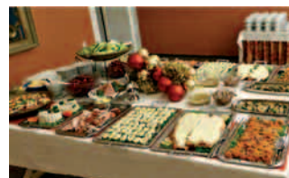
Upseerikerhon maittava joulupöytä.

TEKSTI: JARMO LAINE KUVAT: MAARIT HILTUNEN, MARKKU SELONEN