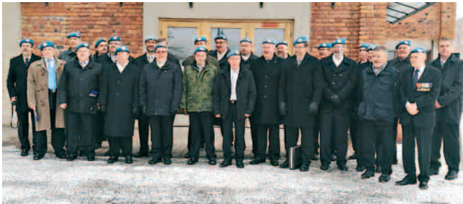
PHRT valmiina juhliin.