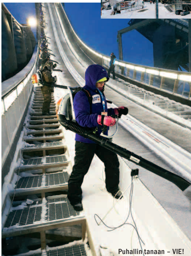
Puhallin tanaan - VIE!