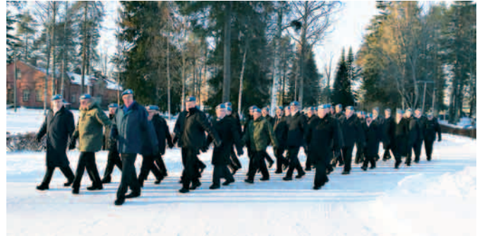
Tahti ja ryhti kohdallaan.

TEKSTI: JARMO LAINE