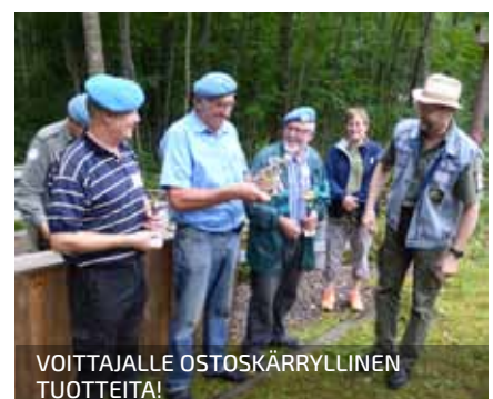
VOITTAJALLE OSTOSKÄRRYLLINEN TUOTTEITA!