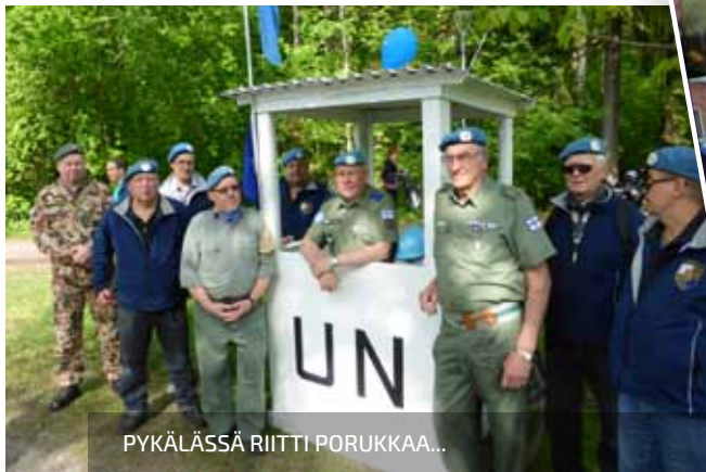
PYKÄLÄSSÄ RIITTI PORUKKAA...

TEKSTI: JARMO LAINE