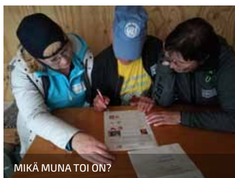
MIKÄ MUNA TOI ON?