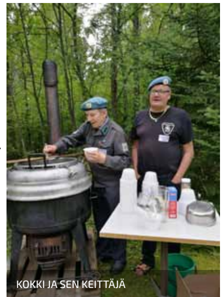
KOKKI JA SEN KEITTÄJÄ

TEKSTI: JARMO LAINE