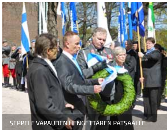
SEPPELE VAPAUDEN HENGETTÄREN PATSAALLE