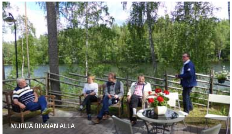
MURUA RINNAN ALLA