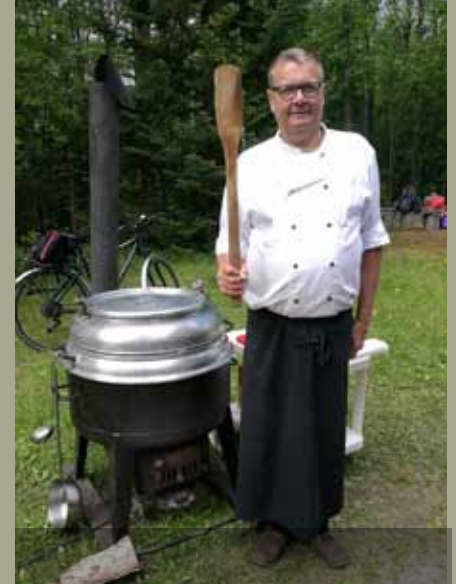
KOKKI JA SEN ALFA- KEITIN