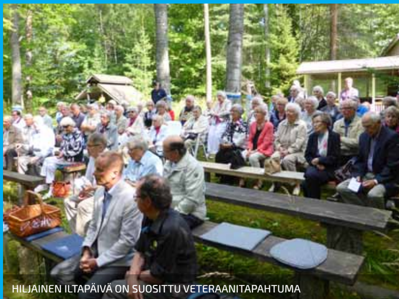
HILJAINEN ILTAPÄIVÄ ON SUOSITTU VETERAANITAPAHTUMA