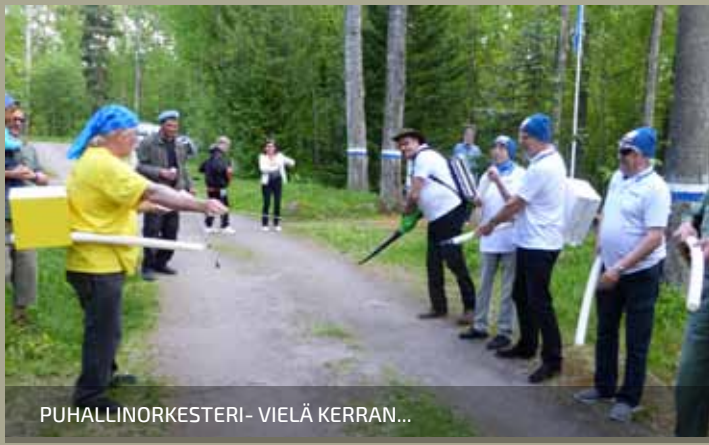
PUHALLINORKESTERI- VIELÄ KERRAN...