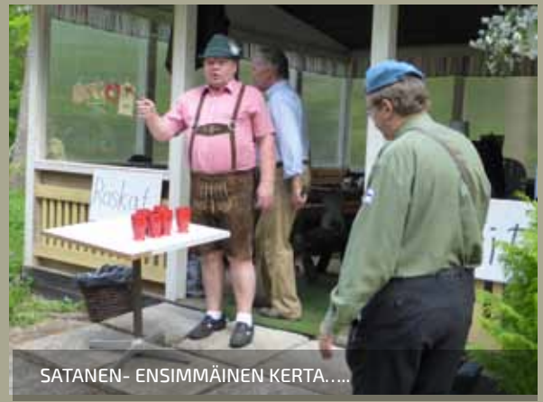
SATANEN- ENSIMMÄINEN KERTA.....