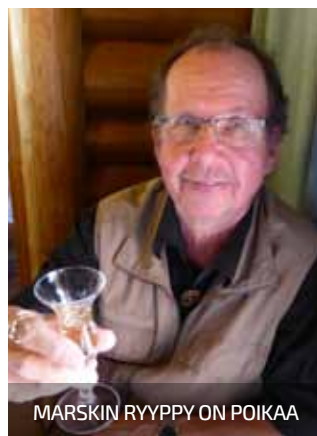
MARSKIN RYYPPI ON POIKAA