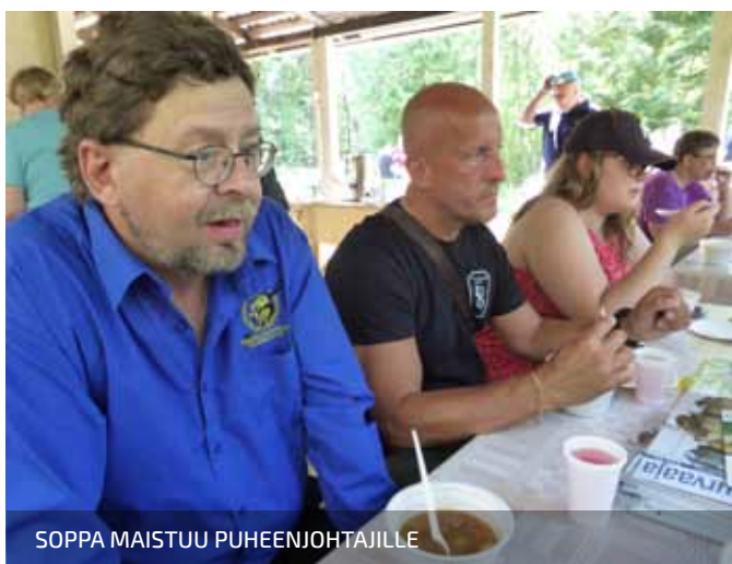
SOPPA MAISTUU PUHEENJOHTAJILLE