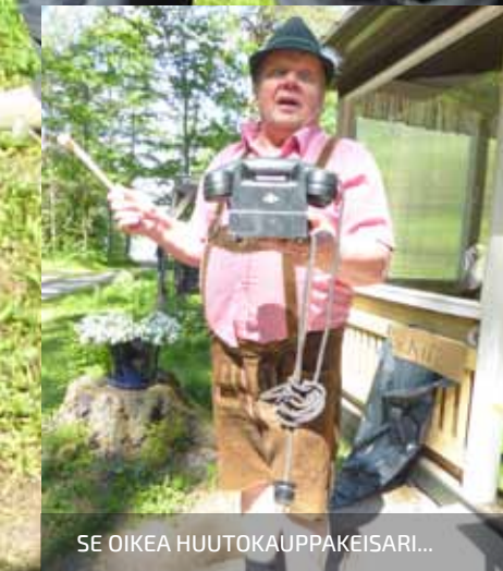
SE OIKEA HUUTOKAUPPAKEISARI...