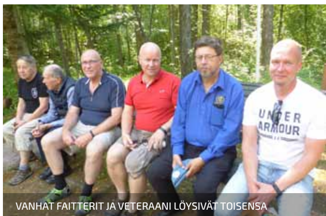
VANHAT FAITTERIT JA VETERAANI LÖYSIVÄT TOISENSA