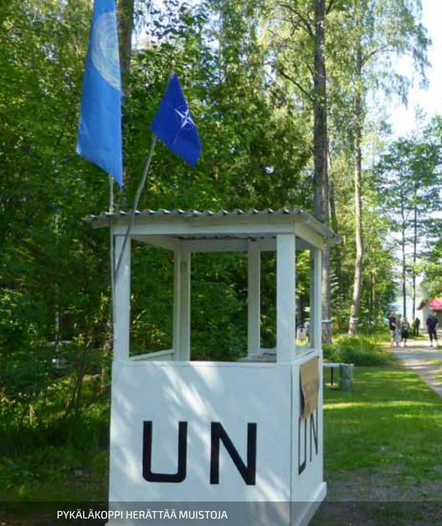
PYKÄLÄKOPPI HERÄTTÄÄ MUISTOJA