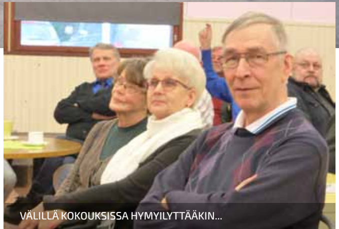
VÄLILLÄ KOKOUKSISSA HYMYLYTTÄÄKIN...