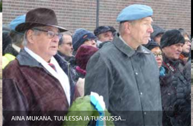
AINA MUKANA, TUULESSA JA TUISKUSSA...