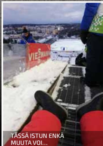
TÄSSÄ ISTUN ENKÄ MUUTA VOI...