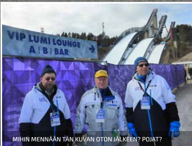
MIHIN MENNÄÄN TÄN KUVAN OTON JÄLKEEN? POJAT?