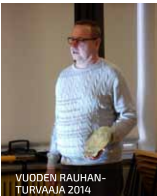
VUODEN RAUHANTURVAAJA 2014

TEKSTI: JARMO LAINE