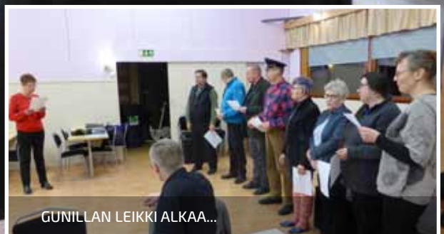
GUNILLAN LEIKKI ALKAA...