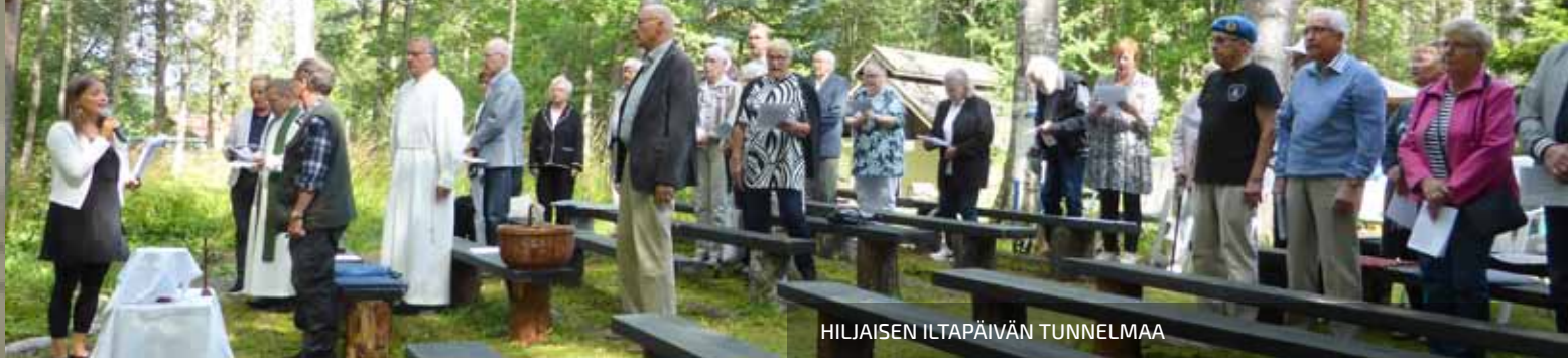
HILJAISEN ILTAPÄIVÄN TUNNELMAA

Päijät Hämeen Rauhan- turvaajat ry on, korona- rajoitukset huomioiden, osallistunut keväällä ja kesällä 2020 moniin Vete- raanitapahtumiin.