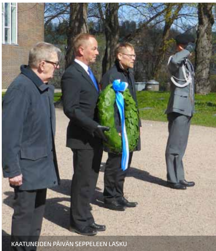
KAATUNEIDEN PÄIVÄN SEPPELEEN LASKU

TEKSTI: JARMO LAINE