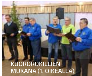
KUOROROKILLIEN MUKANA (1. OIKEALLA)