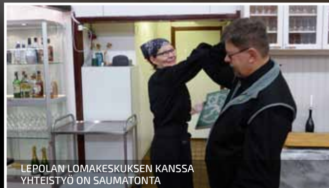
LEPOLAN LOMAKESKUKSEN KANSSA YHTEISTYÖ ON SAUMATONTA