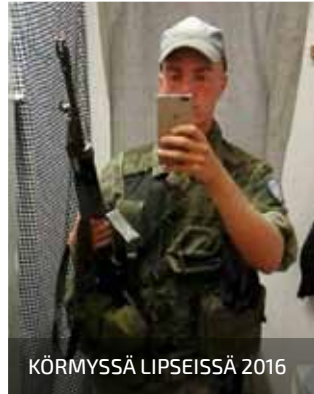
KÖRMYSSÄ LIPSEISSÄ 2016

Päijät-Hämeen Rauhanturvaajat ry:n yksi suurista kysymyksistä on jo pitkään ollut nuoren polven löytäminen mukaan toimintaan.