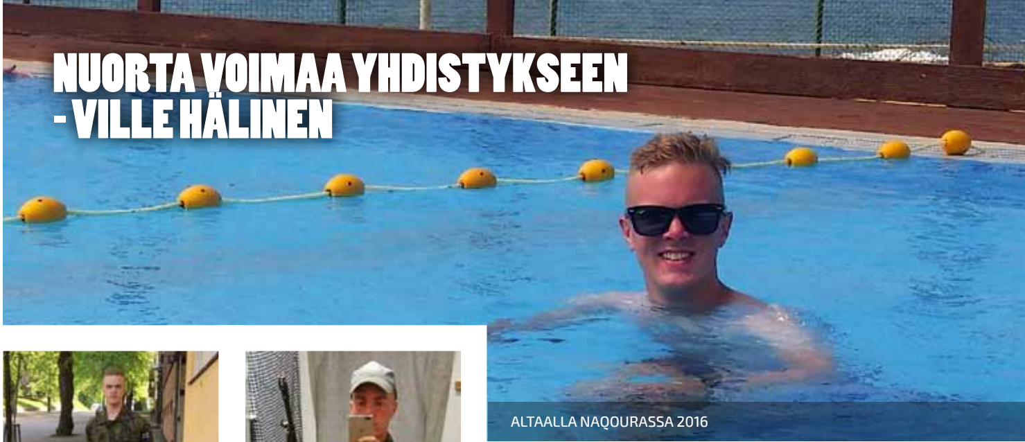
ALTAALLA NAQOURASSA 2016