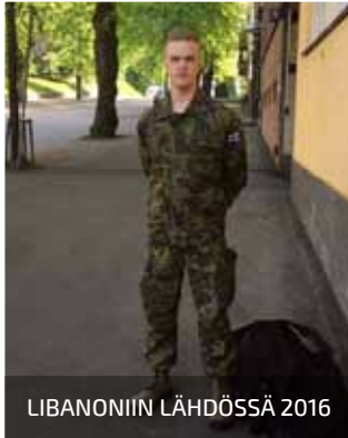
LIBANONIIN LÄHDÖSSÄ 2016