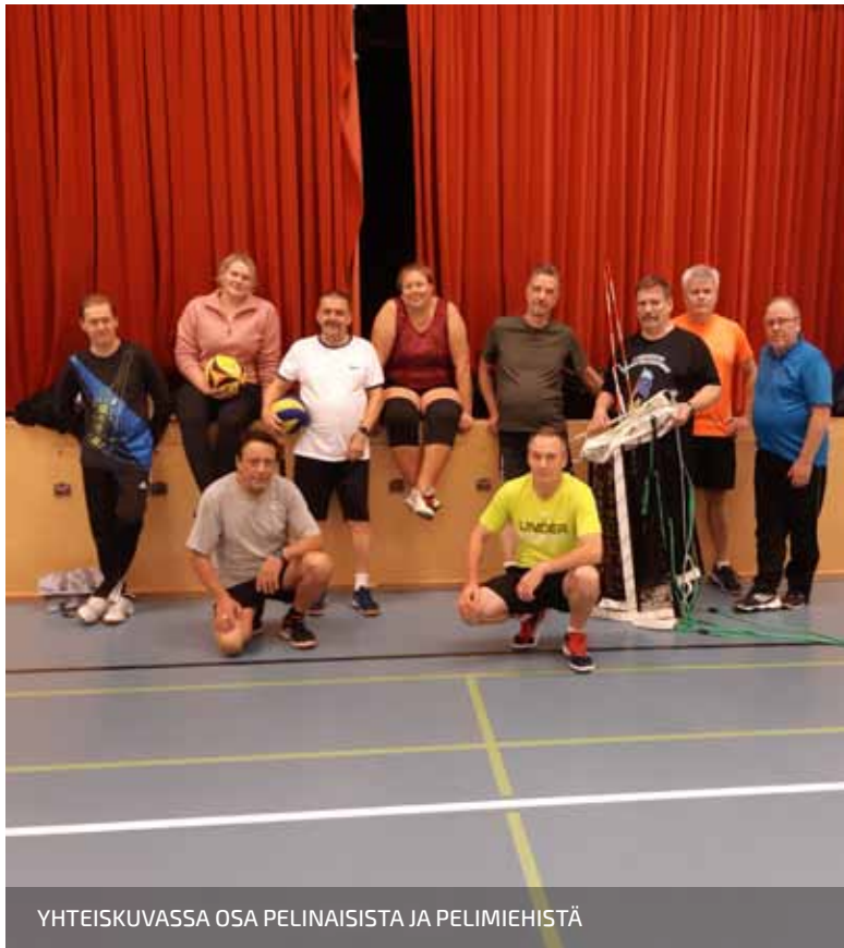
YHTEISKUVASSA OSA PELINAISISTA JA PELIMIEHISTÄ