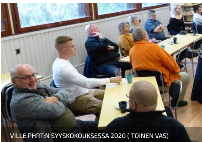
VILLE PHRT:N SYYSKOKOUKSESSA 2020 ( TOINEN VAS)

TEKSTI: JARMO LAINE