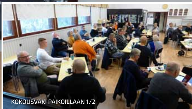
KOKOUSVÄKI PAIKOILLAAN 1/2