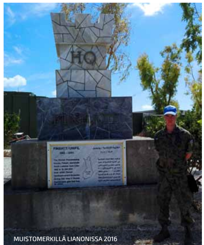
MUISTOMERKILLÄ LIANONISSA 2016