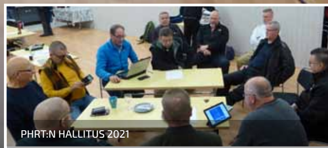
PHRT:N HALLITUS 2021