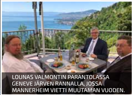
LOUNAS VALMONTIN PARANTOLASSA GENEVE JÄRVEN RANNALLA, JOSSA MANNERHEIM VIETTI MUUTAMAN VUODEN.