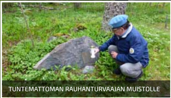
TUNTEMATTOMAN RAUHANTURVAAJAN MUISTOLLE