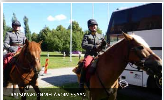
RATSUVÄKI ON VIELÄ VOIMISSAAN