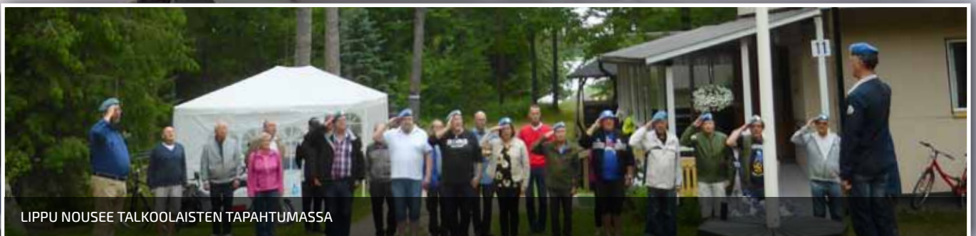
LIPPU NOUSEE TALKOOLAISTEN TAPAHTUMASSA