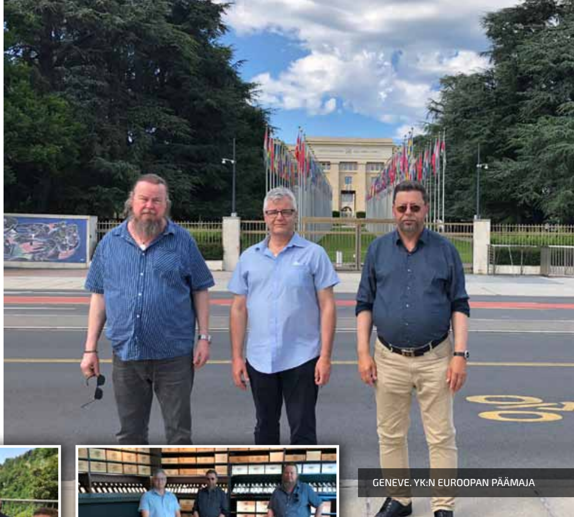
GENEVE. YK:N EUROOPAN PÄÄMAJA