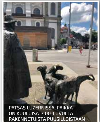
PATSAS LUZERNISSA; PAIKKA ON KUULUISA 1400-LUVULLA RAKENNETUISTA PUUSILLOISTAAN