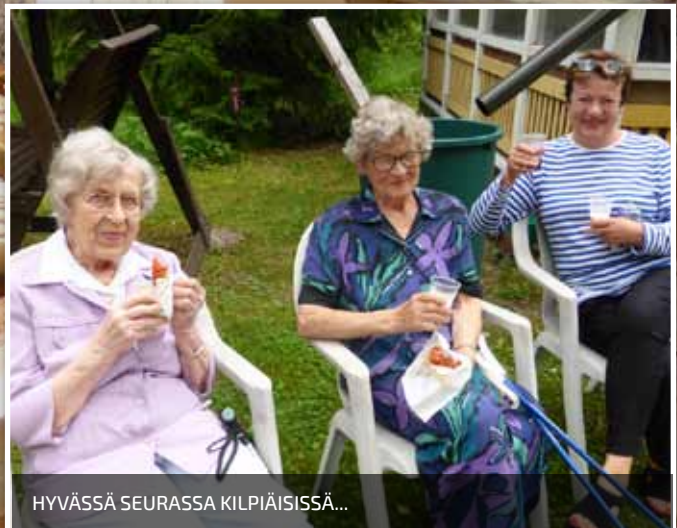
HYVÄSSÄ SEURASSA KILPIÄISSÄ...