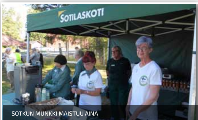
SOTKUN MUNKKI MAISTUU AINA