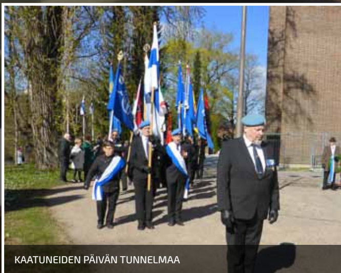
KAATUNEIDEN PÄIVÄN TUNNELMAA