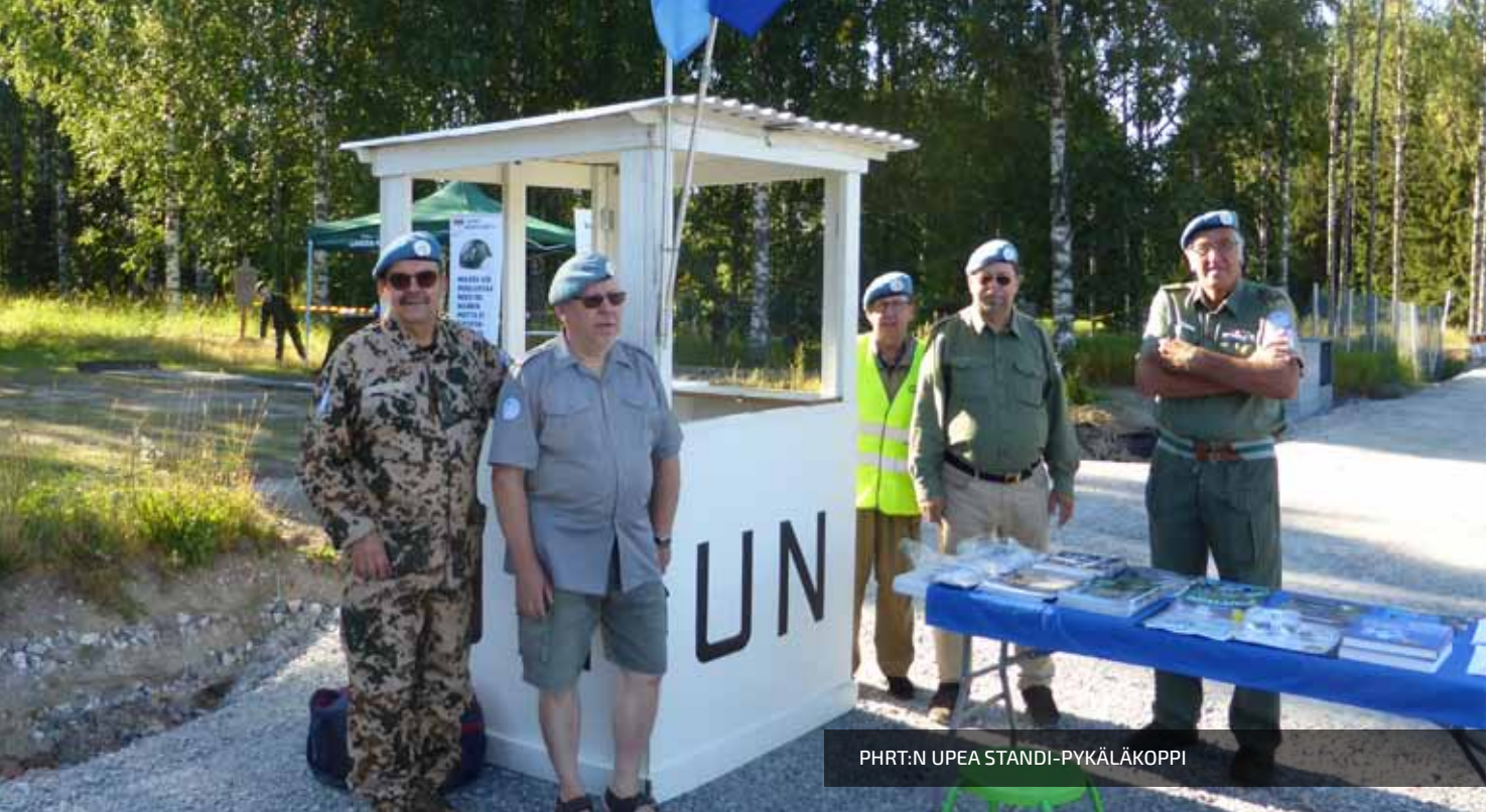
PHRT:N UPEA STANDI-PYKÄLÄKOPPI