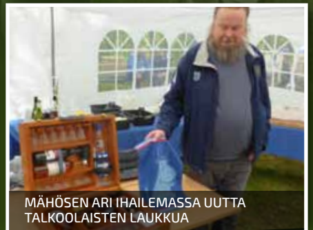
MÄHÖSEN ARI IHAILEMSSA UUTTA TALKOOLAISTEN LAUKKUA