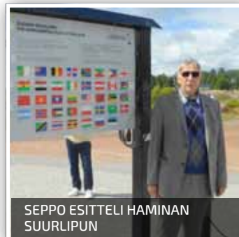
SEPPÖ ESITTELI HAMINAN SUURLIPUN