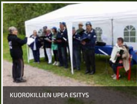
KUOROKILLIEN UPEA ESITYS