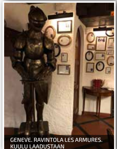
GENEVE. RAVINTOLA LES ARMURES. KUULU LAADUSTAAN

Siirryimme seuraavaksi Montreux'n kaupunkiin, jossa yöpyminen. Seuraavana aamuna menimme lähellä Marsalkan puistoa olevaan anglikaaniseen kirkkoon, jossa oli suomenkielinen jumalanpalvelus. Sitten siirryimme puistoon, jossa sveitsiläisen sotilassoittokunnan tahdittamana menimme seppeleiden laskuun Marsalkanmuumentille. Juhlavan tilaisuuden päätteeksi puistossa nautittiin virvokkeita, sekä jatkettiin edellisenä iltana käytyjä keskusteluja.