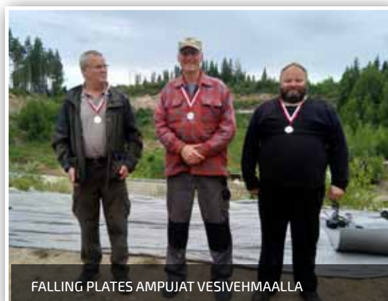
FALLING PLATES AMPUJAT VESIVEHMAALLA