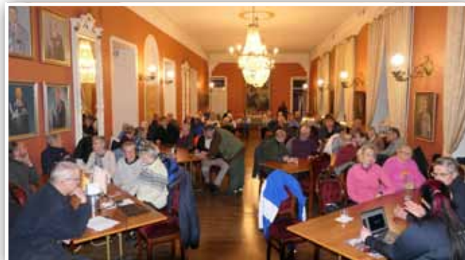
TEKSTI: MERJA JYLHÄNNISKA