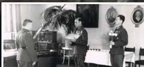
1947 LAATIKAINEN 50 V, SAVONJOUSI, HIRVELÄ